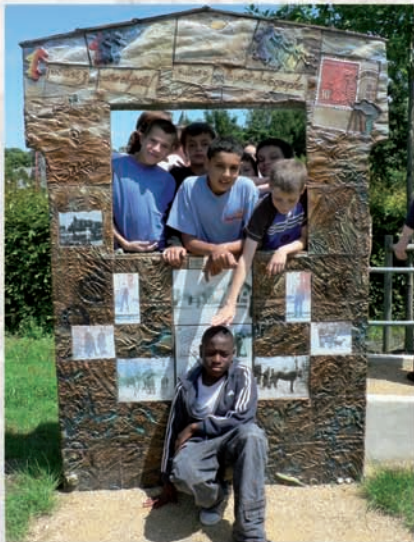
Le castelet du petit photographe