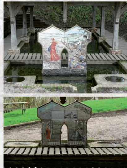
Monument à l'amoureux inconnu

Ces monuments ont été réalisés en céramique sur des supports en ciment armé