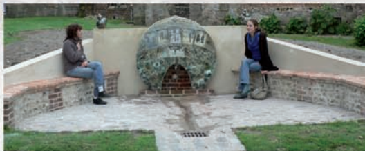
La fontaine des rencontres.